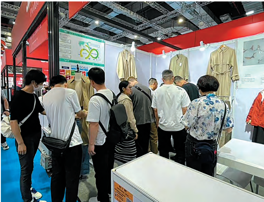
▲ 大勢の方に製品を紹介することができました